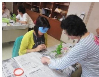
第6回ロールプレイ