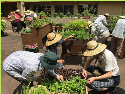
園芸療法活動の様子

植物は人の心を癒し、穏やかにし、和ませる力があり、園芸作業は人の心や身体を前向きに能動的にする力があります。植物や園芸作業を活用するリハビリテーションとしての“園芸療法”。その考え方や手法を取り入れて、自分の中に種をまき、地域の中でボランティアとして活躍しませんか？