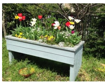
第3回レイズドベッド